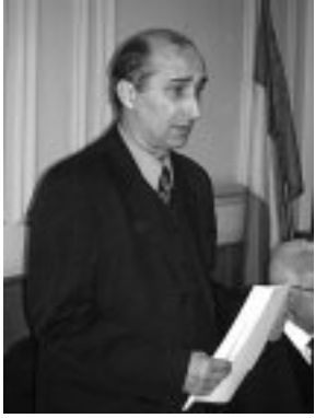
Onorat prezidiu, Domnule prefect,