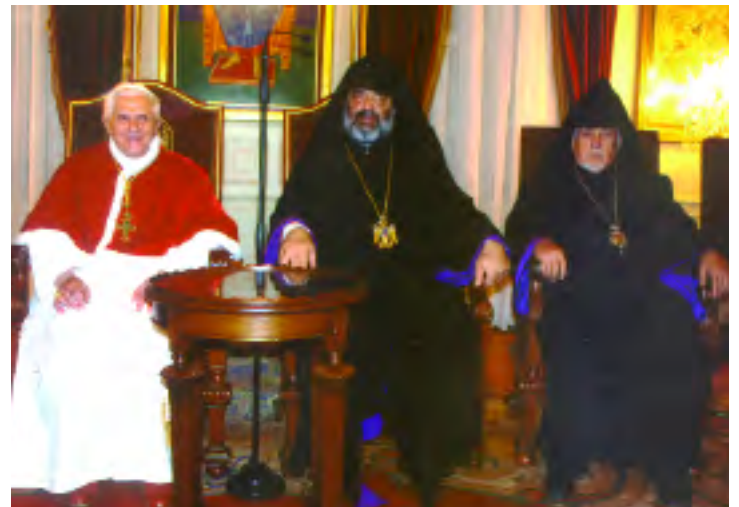
Papa Benedict al XVI-lea alături de Î.P.S. Arhiepiscop Mesrob Mutafian Patriarhul Bisericii Armenice din Constantinopole și I.P.S. Arhiepiscop Dirayr Mardichian

Pe data de 30 noiembrie 2006, Înalț Preasfinția Sa Arhiepiscop Dirayr Mardichian s-a aflat la Patriarhia Armeană din Constantinopole unde a participat la festivitățile prilejuite de vizita în Turcia a Sanctității Sale Papa Benedict al XVI-lea.