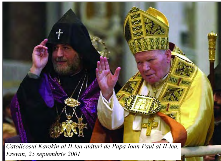
Catolicul Karekin al II-lea alături de Papa Ioan Paul al II-lea, Erevan, 25 septembrie 2001

[...] În îndelungata sa istorie, poporul armean a plătit un preț scump pentru fidelitatea față de propria sa identitate. Ajunge să ne gândim la înspăimîntătoarea exterminare în masă suferită la începutul secolului al XX-lea. Pentru amintirea veșnică a acelor victime - circa un milion și jumătate în doar trei ani - aproape de capitala Erevan se înalță un solemn memorial, unde, împreună cu Catolicul Tuturor Armenilor, am înălțat o rugăciune intensă pentru cei morți și pentru pace în lume. [...]