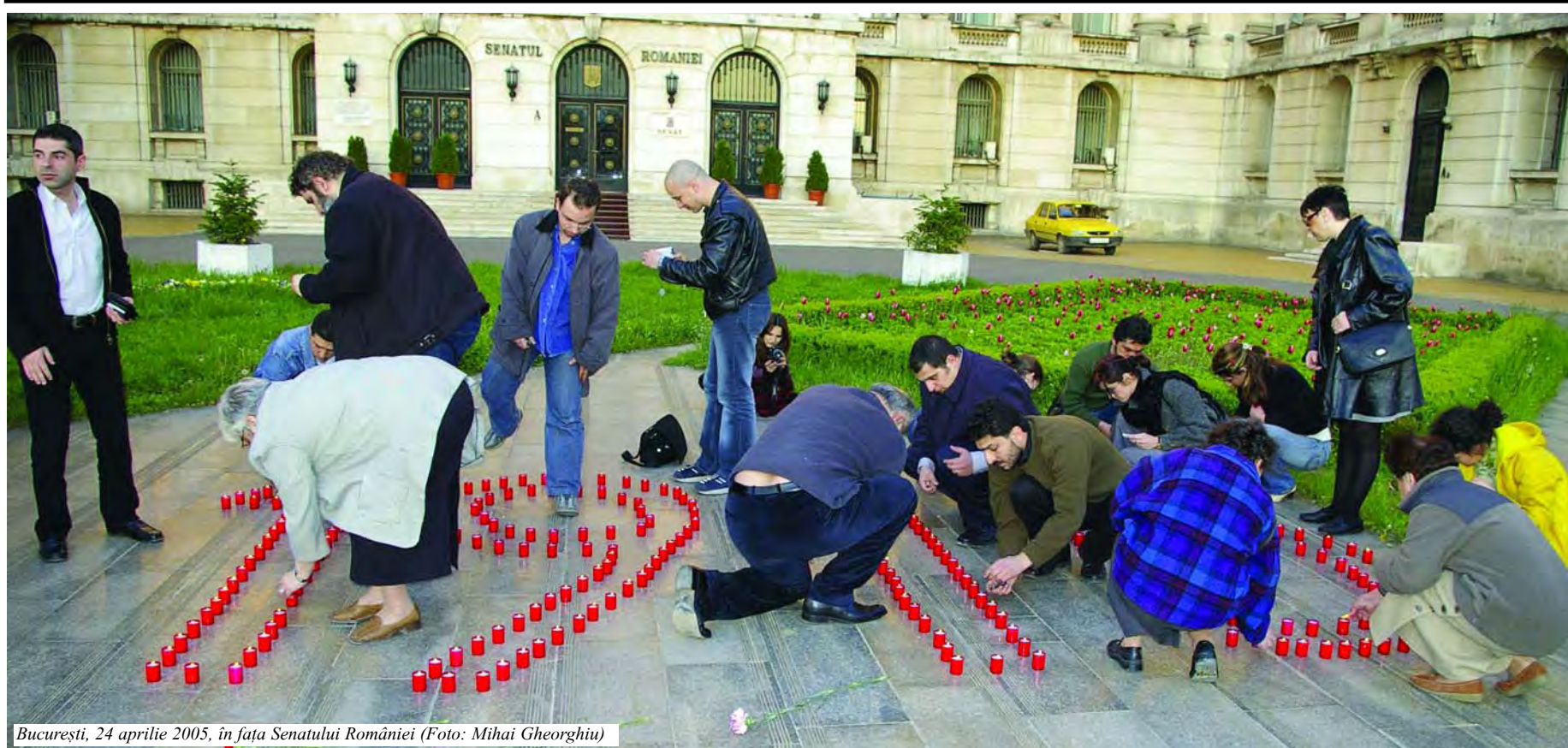
București, 24 aprilie 2005, în fața Senatului României

Nu credem că în ultimii 15 ani, ca să nu spun mai mult, s-au organizat în București atâtea manifestări având ca scop principal comemorarea Genocidului săvârșit în 1915 împotriva poporului armean. Poate că împlinirea a 90 de ani de la declanșarea crimelor împotriva armenilor ne-au mobilizat în a arăta că nu uităm tragedia noastră dar, în același timp, dorim să fie cunoscută și în această țară. Pentru că în anii ce au trecut în afară de revistele noastre sau de