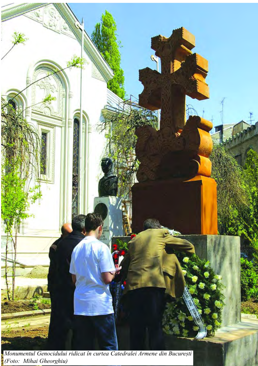
Monumentul Genocidului ridicat în curtea Catedralei Armene din București