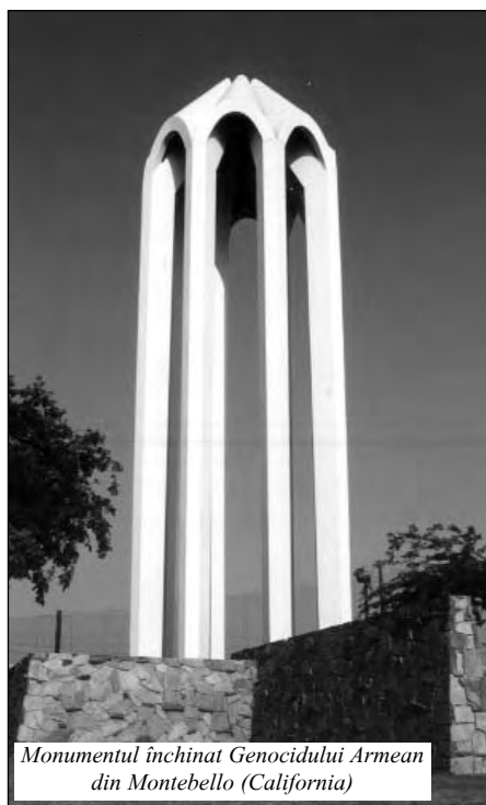
Monumentul închinat Genocidului Armean din Montebello (California)

În fiecare an pe data de 24 aprilie, armeanii de pretutindeni comemorează genocidul săvârșit neamului nostru între anii 1915-1921 de către turci. Eu însumi sînt un supraviețuitor al genocidului, căci familia mea a fost nevoită să fugă de pe meleagurile natale din Constantinopol, astăzi Istanbul. Acum sînt cetățean american și locuiesc în Naples, Florida, alături de familia mea.