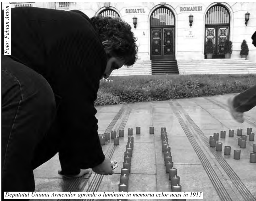
Deputatul Uniunii Armenilor aprinde o luminare în memoria celor uciși în 1915

Ascultă, Doamne, glasul Episcopului Romei cînd prelungeste către Tine rugăciunea predecesorului său, Papa Benedict al XV-lea, cel ce și-a înălțat glasul în anul Domnului 1915, în apărarea poporului armean, amarnic lovit și adus în pragul anihilării”.