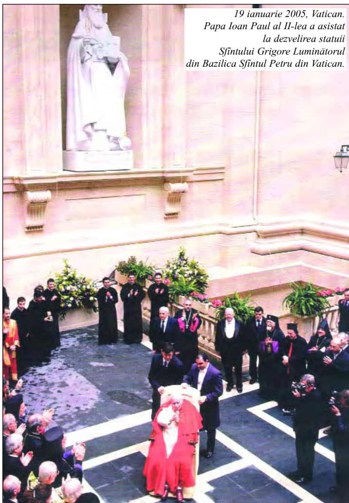
19 ianuarie 2005, Vatican. Papa Ioan Paul al II-lea a asistat la dezvelirea statuiei Sfințului Grigore Luminătorul din Bazilica Sfințului Petru din Vatican.

Având pe deget inelul dăruit de Sanctitatea Sa și astfel plin de